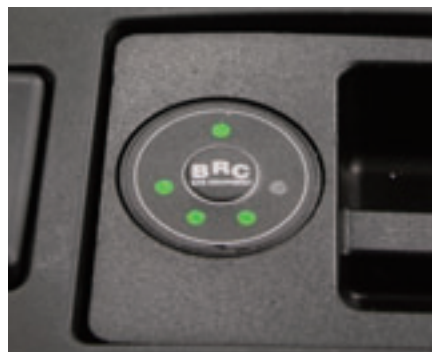
Bränslemätaren för gas, mellan stolarna, visar tydligt när det är dags att fylla på.