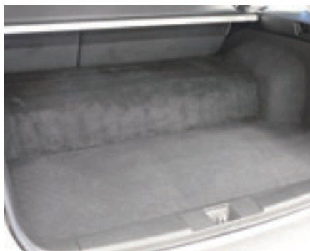
Säker, diskret gastank i kompositmaterial. Gömd i bagageutrymmet.

Förutom ett rent samvete ger Subaru Boxer-CNG fördelar för dig som tjänstebilsförare. Eftersom Subaru Boxer-CNG klassas som miljöbil åtnjuter du 40 % reducerat förmånsvärde och fem års befrielse från fordonsskatt. Reduktionen är maximalt 16 000 kronor per år.