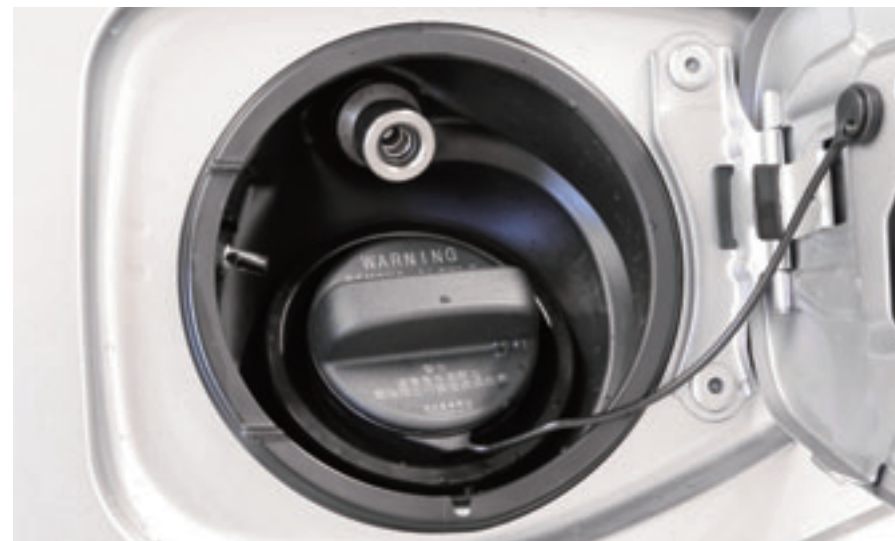
Påfyllning sker enkelt via separat ventil innanför tankluckan.

Subaru har Sveriges mest nöjda bilägare enligt AutoIndex 2011. Subaru vann även 2010, 2009 och 2007. Med nya Subaru Boxer-CNG satsar vi på att få Sveriges mest nöjda miljöbilsägare.